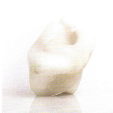
Sculpture, Aldo Grossini